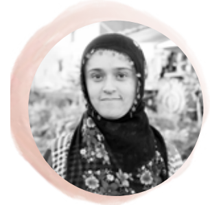
Mine Aslan Güryıldız Köyü

Topluluk iyi bir şey. Daha güçlü olduk. Biraz daha kendini güçlü hissediyorsun.